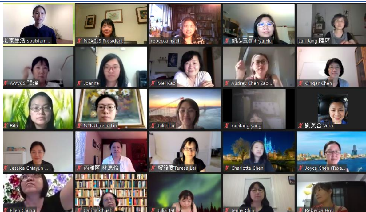
參與培訓的老師們(三)