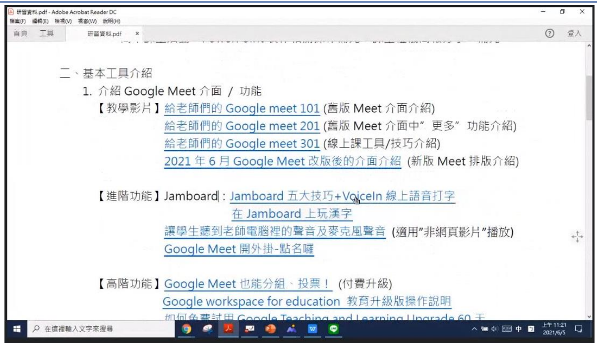
漢字文化節系列-解說線上教學資源軟體