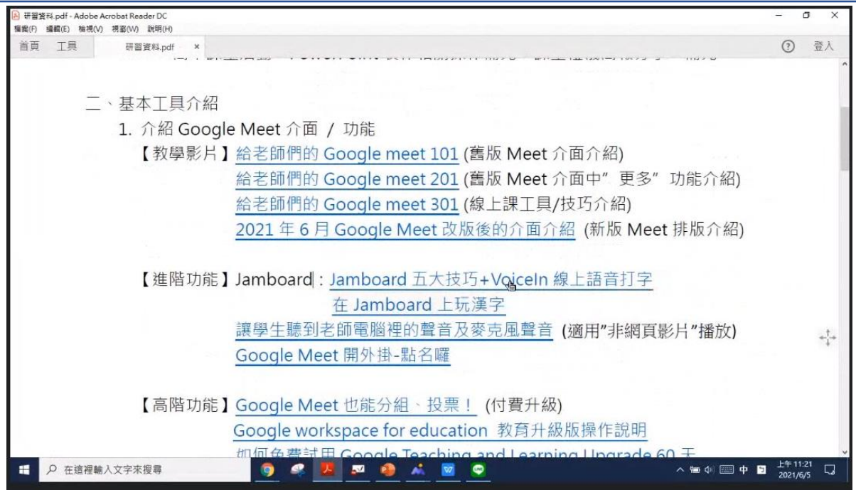
漢字文化節系列-解說線上教學資源軟體