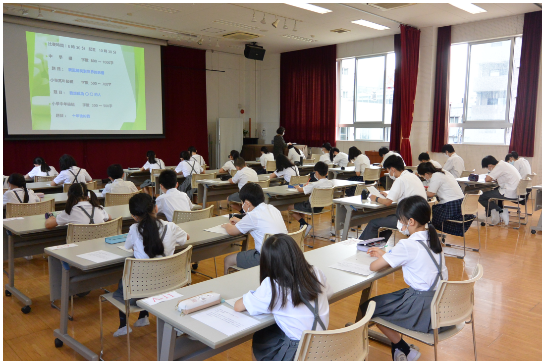
作文比賽參賽全體