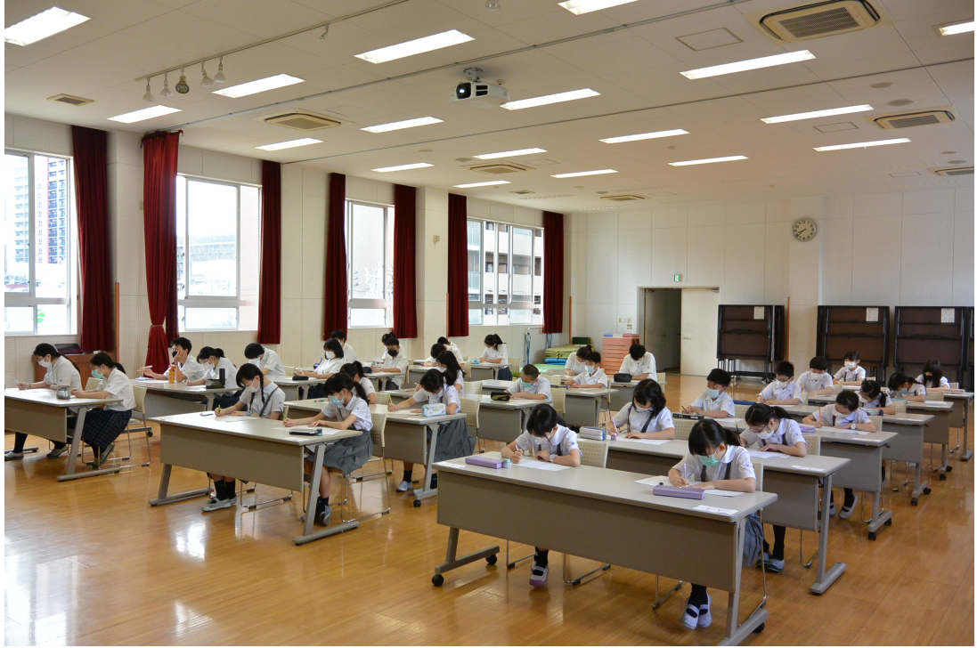
華語文作文比賽會場