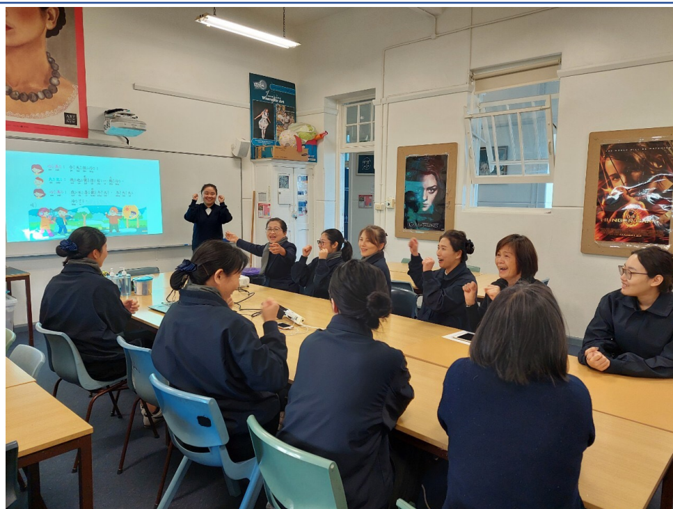
《學華語向前走》線上素材