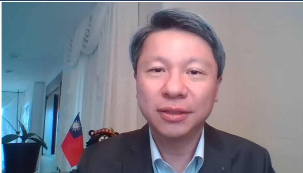
臺北經濟文化辦事處處長-甄國清