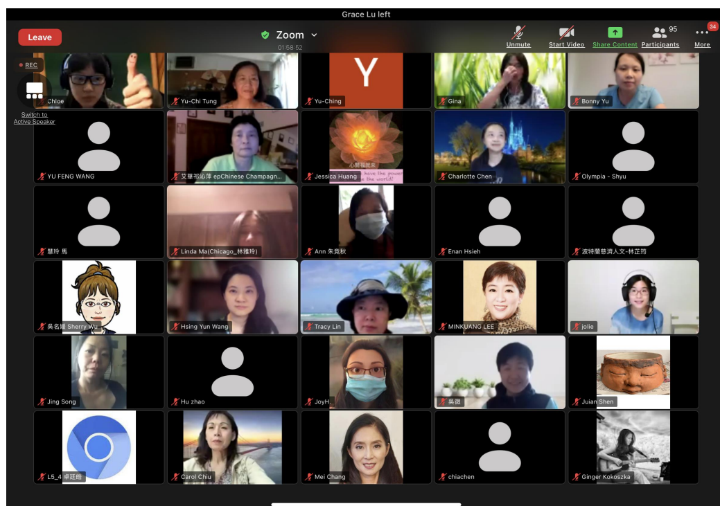
大波特蘭地區 2021 教師研習會（線上）3