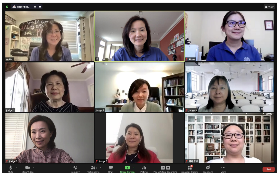
辛苦又開心的評審和工作人員們

5/16 下午2:00 決賽結果出爐，舉行了盛大成功的線上頒獎典禮，得獎學生們除了接受表揚，並將於近期內收到本會郵寄的獎狀及禮卡，典禮中每組第一名得獎學生於線上再次演繹說故事及簡報之得獎內容作品，與會的貴賓和各校代表紛紛稱讚不已，為此次本會舉辦學生線上比賽的成功創舉給予高度的肯定，學生和家長們也對中文學習能有不同方式的呈現成果，表示非常有成就感，並期望本會今後繼續舉辦此類比賽。