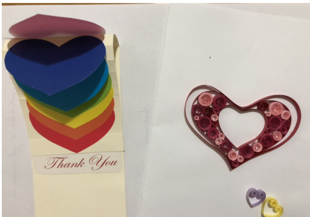
為老師們安排的母親節立體卡片製作課程