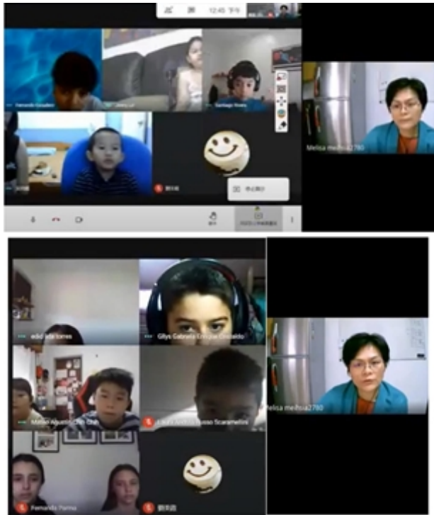
阿人班認讀及聽寫注音符號

這次的注音符號認讀比賽是由阿人班及幼兒中小班的孩子共同參與，出題教師採用線上看題搶答及聽寫兩部分，學生在線上測試中同時檢驗自己的中文程度，大家答題踴躍，競爭激烈，最後遴選出優勝學生15名給予獎勵。