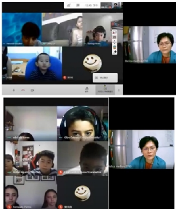
阿人班認讀及聽寫注音符號

這次的注音符號認讀比賽是由阿人班及幼兒中小班的孩子共同參與，出題教師採用線上看題搶答及聽寫兩部分，學生在線上測試中同時檢驗自己的中文程度，大家答題踴躍，競爭激烈，最後遴選出優勝學生15名給予獎勵。