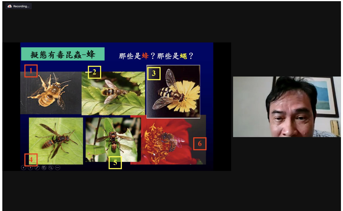
擬態 (mimicry) 的昆蟲