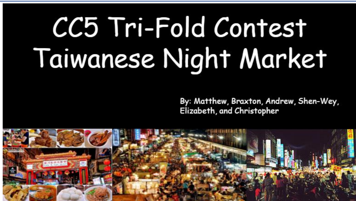
5年級的參賽作品—臺灣夜市