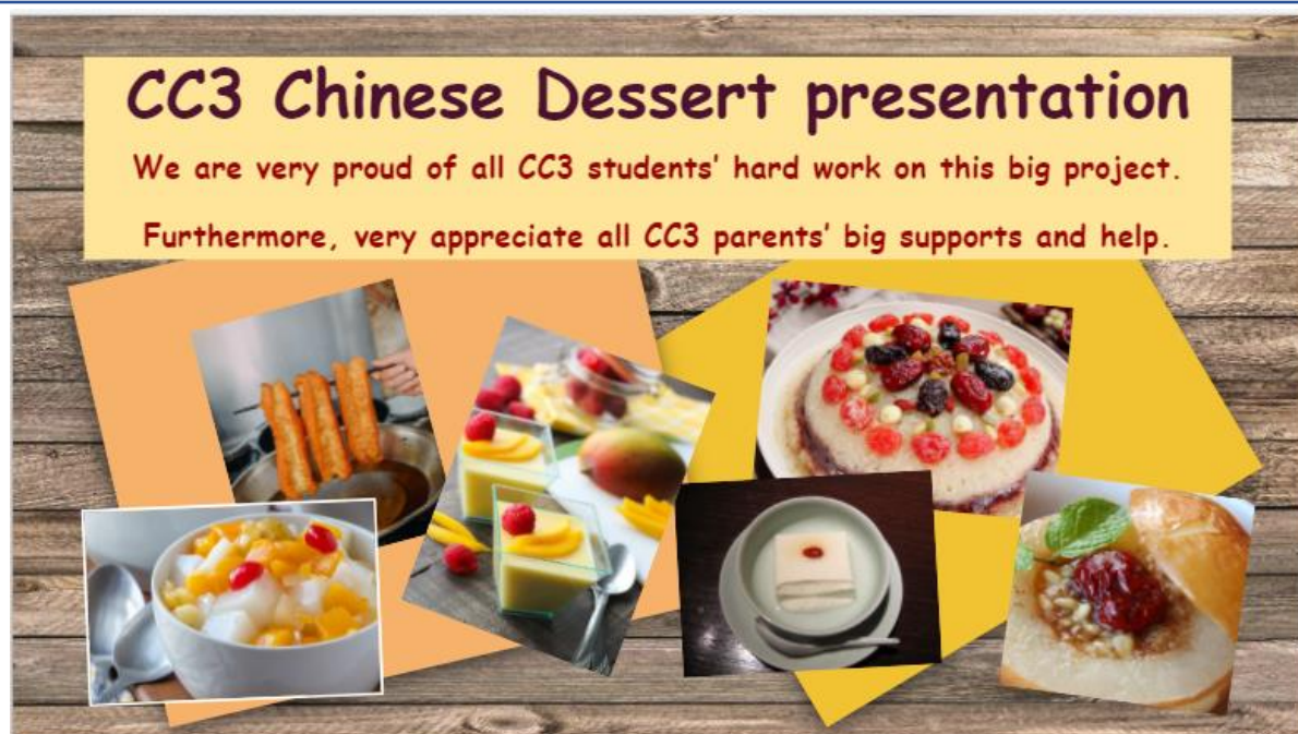
6年級的參賽作品—臺灣甜點私房食譜