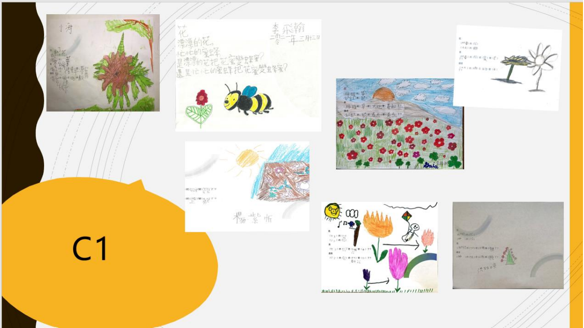
1年級學生精采的創作作品