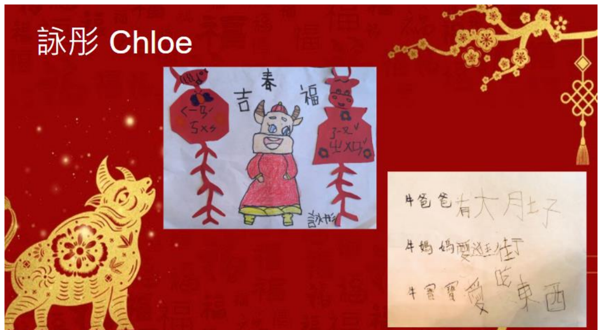
大班孩子創作可愛的畫牛話牛

今年是北卡洛麗中文學校首度在正體漢字文化比賽上使用數位創作，全校師生對此新模式覺得很新鮮、也很喜歡。本次壁報比賽經過激烈競爭，評選出優等、優選、和佳作等名次。校方將頒贈電子禮卡給獲獎班級，以示鼓勵。