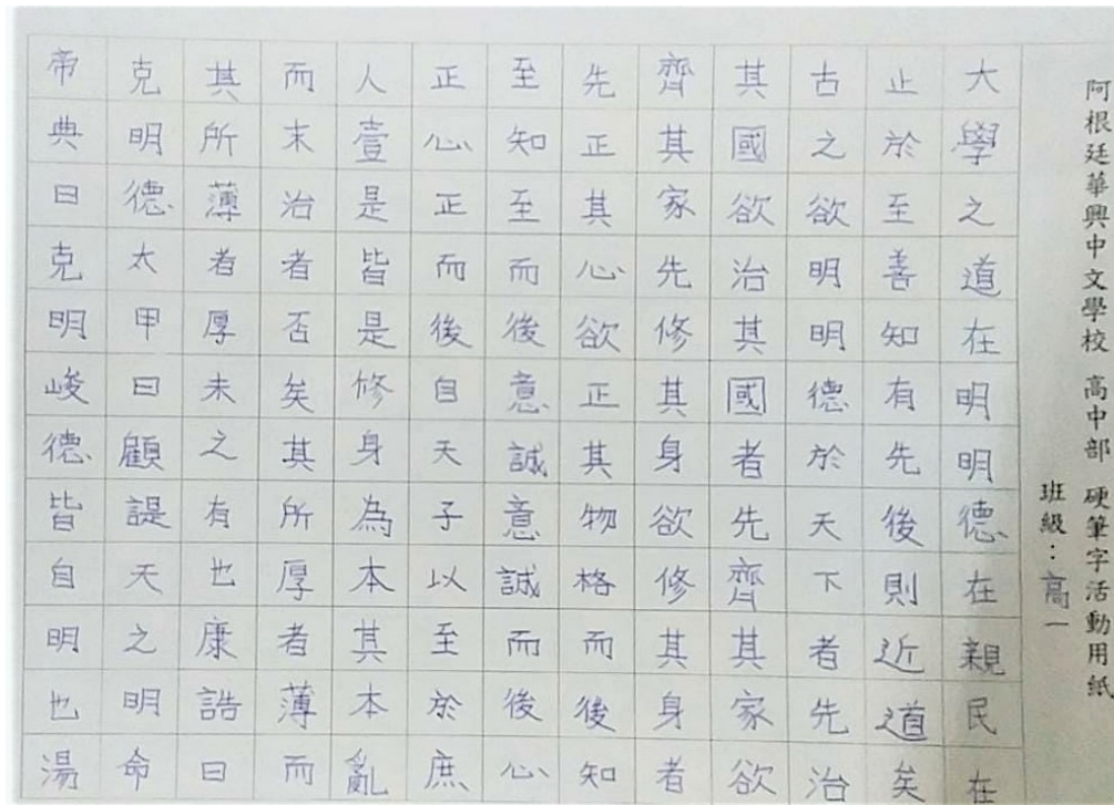
阿根廷華興中文學校 高中部 硬筆字活動用紙 班級：高一

這次硬筆字活動，雖然在線上舉行，也讓學生們拓展了另一個視野，讓中文學習有不一樣的面貌與展現。特別感謝家長及老師們的用心，讓孩子能對中文學習越來越有興趣。