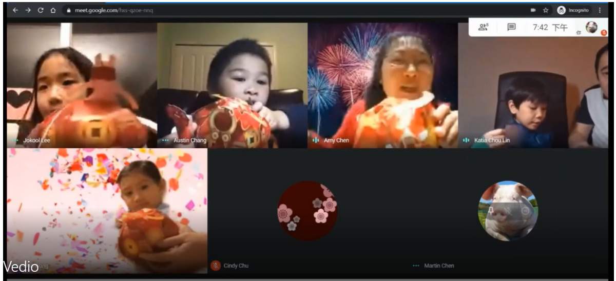
2021 南密中文學校慶祝春節活動—提燈籠慶新年