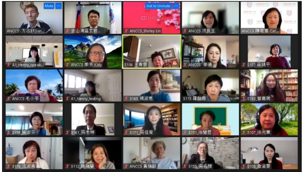
北加州中文學校聯合會 第43屆教學研討會第2場（線上）2