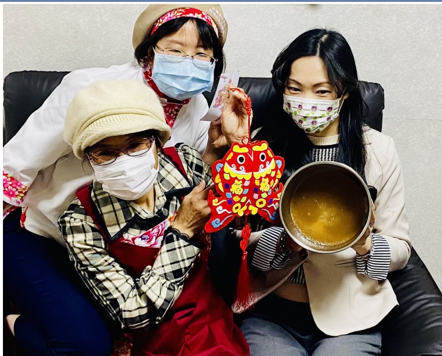
春節雙魚吊飾及年糕完成囉