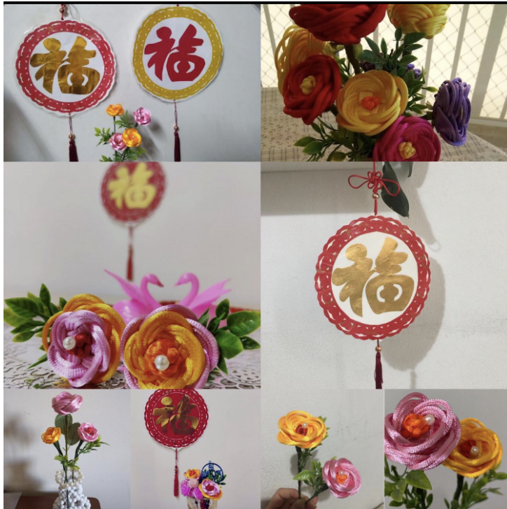
學員學習成果「花開富貴」中國結藝及「福氣臨門」福字掛飾。