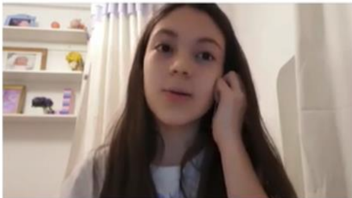
新興教會附屬中文學校 2020 全校歌唱比賽（線上）3