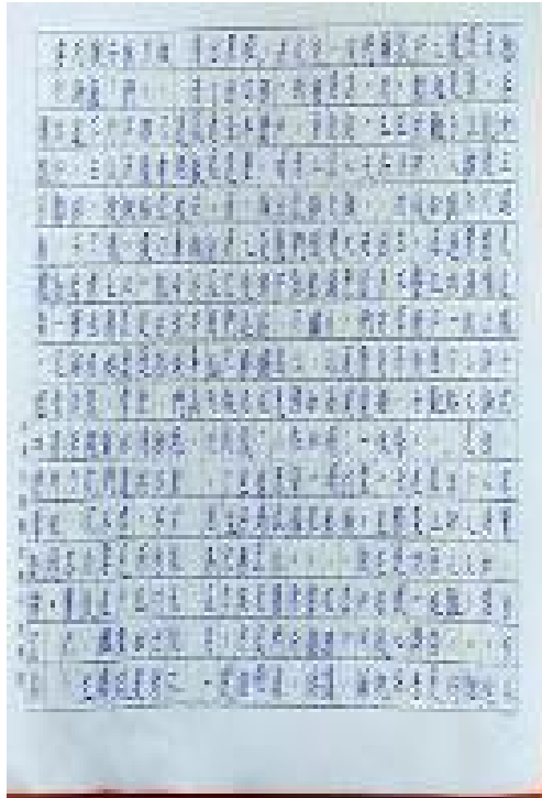
新興教會附屬中文學校 2020 全校作文比賽4