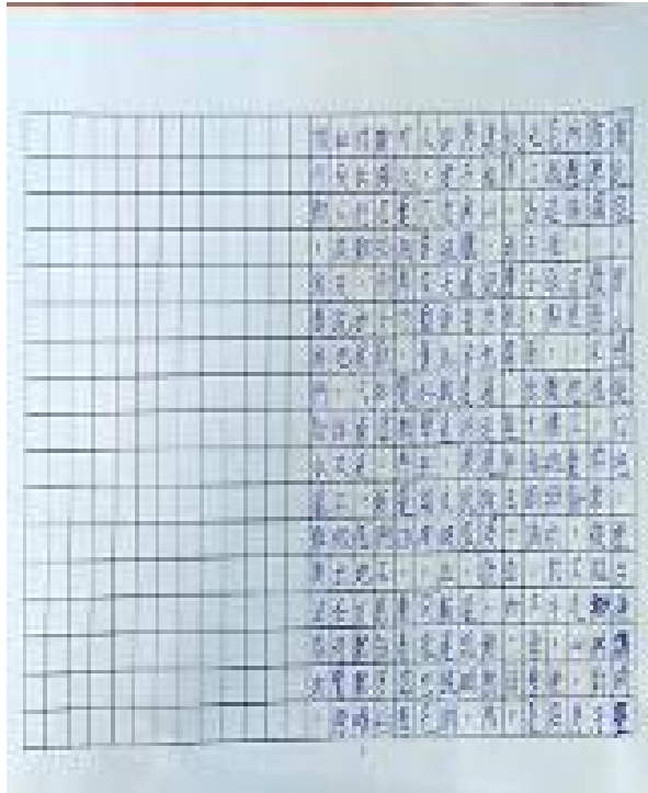
新興教會附屬中文學校 2020 全校作文比賽5