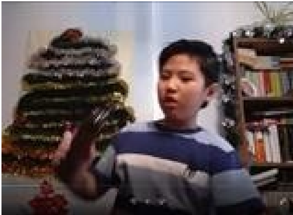
阿根廷國風僑聯中文學校 2020 第4季漢字文化節系列活動：成語故事比賽1

接著我們還進行了成語接龍比賽，一個接一個的成語，同學們賣力的想著，既緊張又有意思。透過這次的成語故事比賽，進一步激發了學生的閱讀興趣，加深了學生對成語故事的理解，也提升了學生的語文及口說能力。