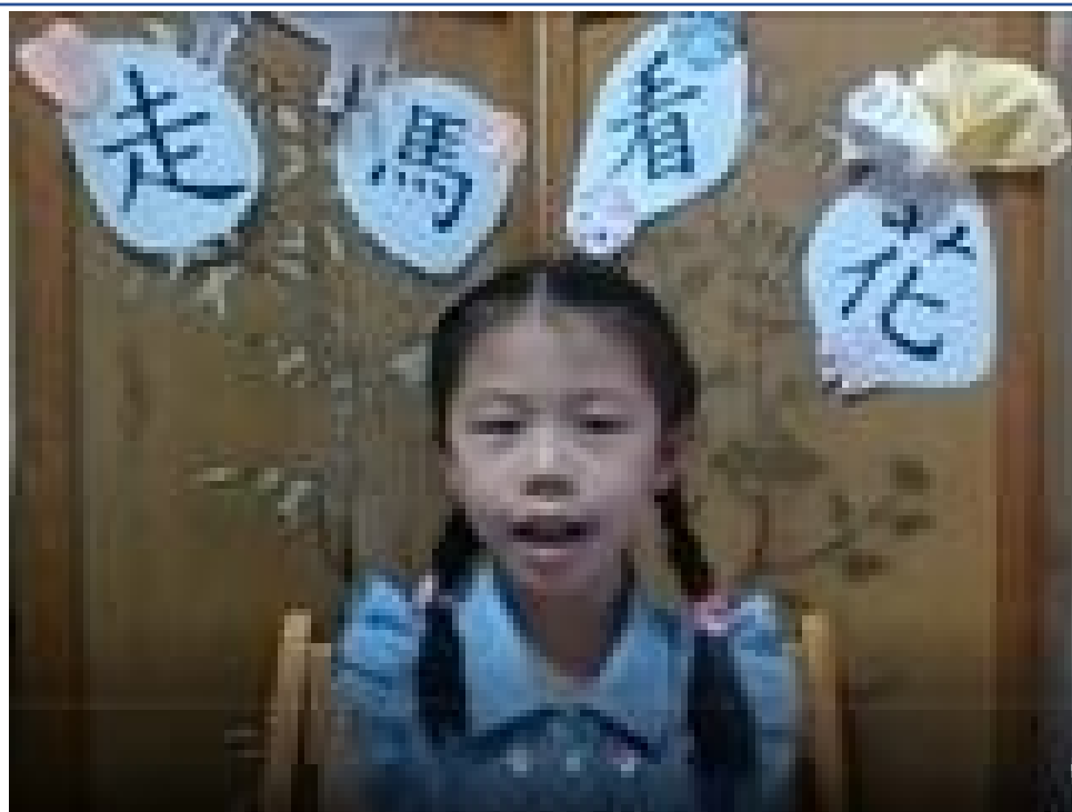
阿根廷國風僑聯中文學校 2020 第四季漢字文化節系列活動：成語故事比賽3