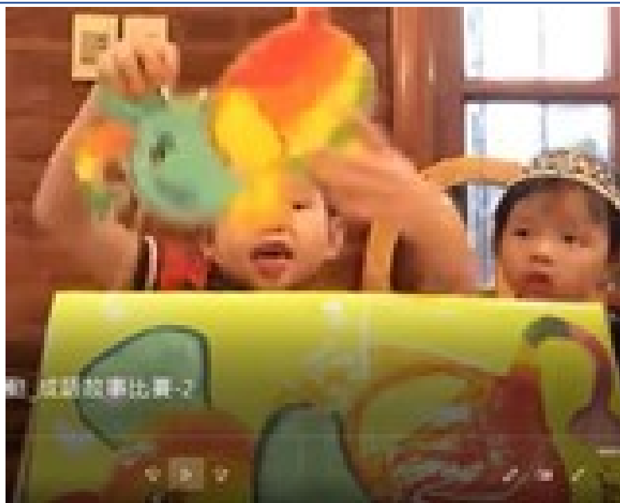
阿根廷國風僑聯中文學校 2020 第4季漢字文化節系列活動：成語故事比賽2