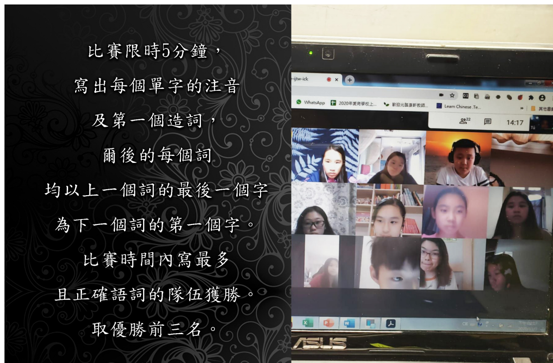
臺灣基督長老教會阿根廷教會附設愛育學校 2020 正體漢字文化節：國小高年級語詞接龍比賽1

在緊張的氣氛中還要顧及團隊的合作情況，線上分組的難度實在要比過去在學校裡實體課堂的競賽要來的多！但這就是成長與學習的必要過程，是克服學習障礙的經驗累積。孩子們經過8個月的居家隔離及線上上課，體驗到如此不容易的生活方式，個個都顯得成熟許多了。