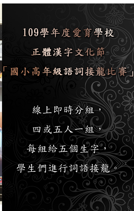
臺灣基督長老教會阿根廷教會附設愛育學校 2020 正體漢字文化節：國小高年級語詞接龍比賽2