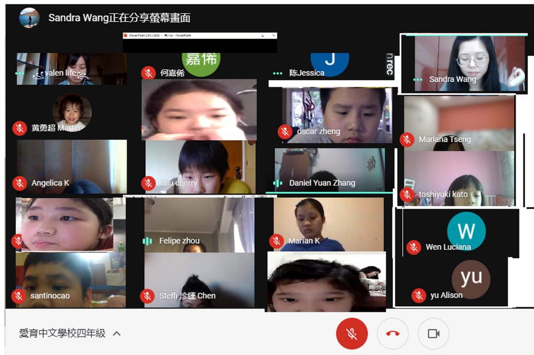
國小中低年級組造詞比賽（4年級）