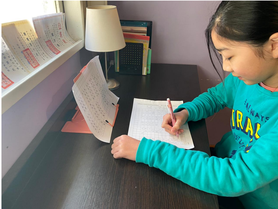
臺灣基督長老教會阿根廷教會附設愛育學校 2020 正體漢字文化節：硬筆字書寫比賽5