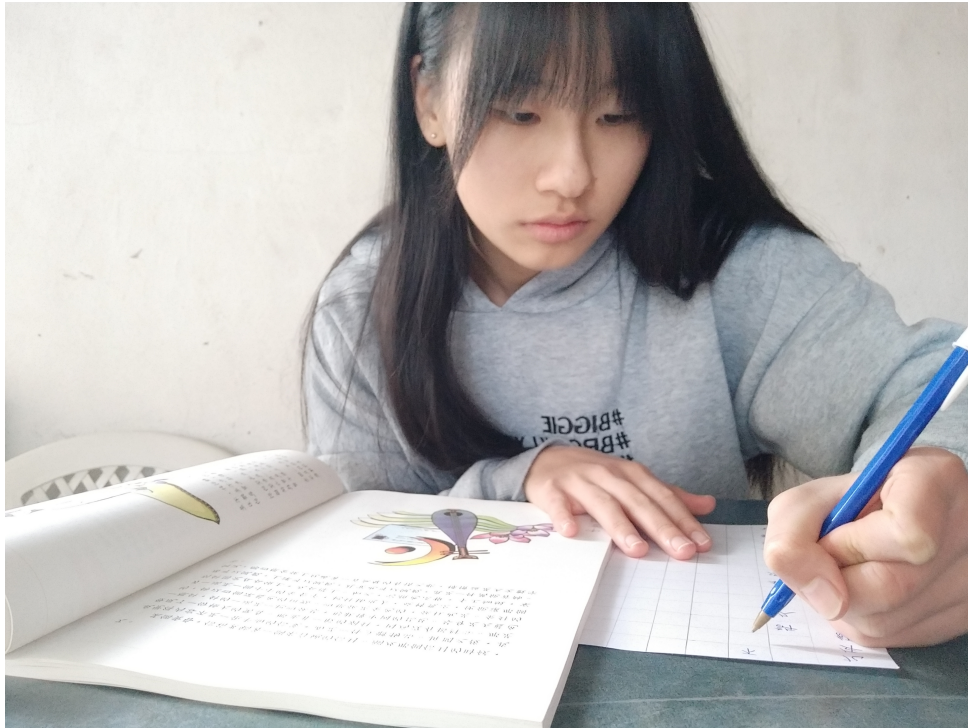
臺灣基督長老教會阿根廷教會附設愛育學校 2020 正體漢字文化節：硬筆字書寫比賽6