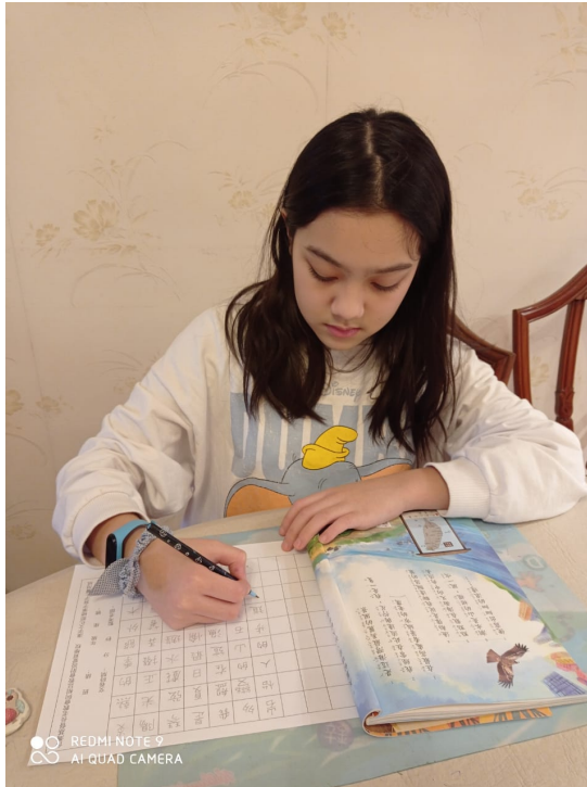
臺灣基督長老教會阿根廷教會附設愛育學校 2020 正體漢字文化節：硬筆字書寫比賽2