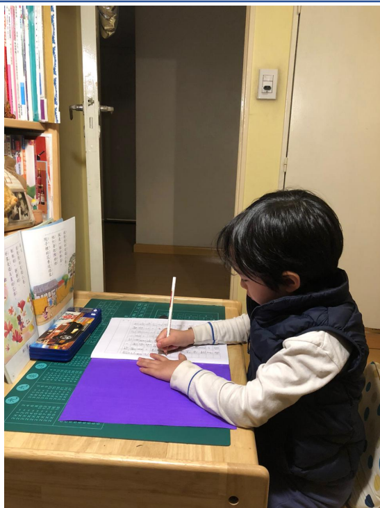
臺灣基督長老教會阿根廷教會附設愛育學校 2020 正體漢字文化節：硬筆字書寫比賽4