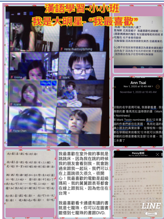
喜樂中文學校 2020 第四季正體漢字文化節活動1