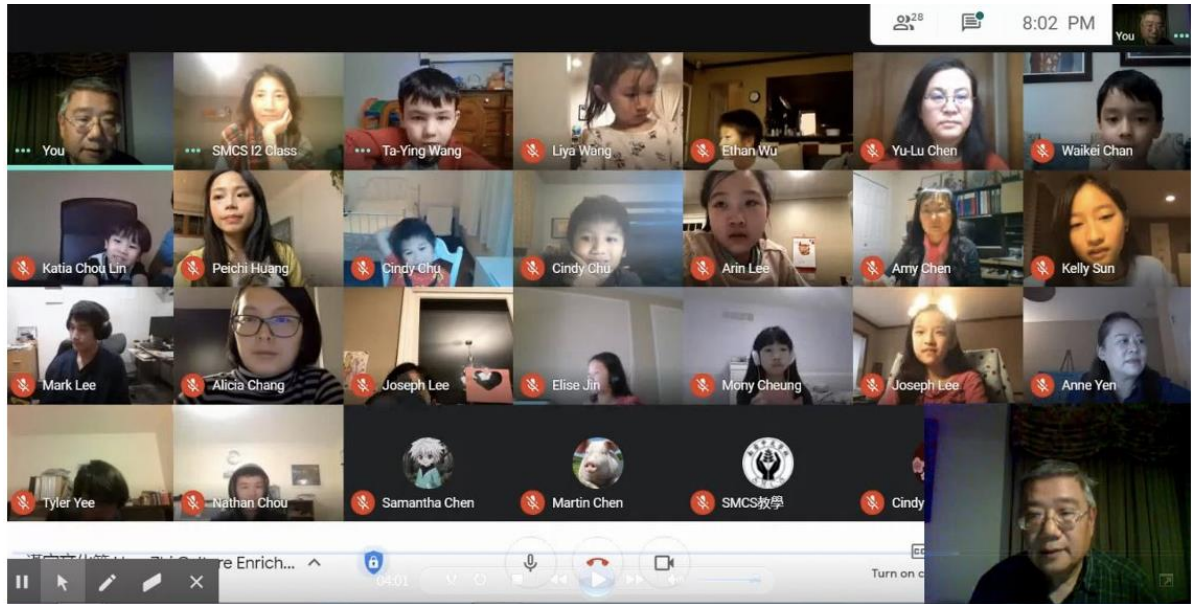
南密西根中文學校 2020 正體漢字文化節活動：中文打字暨漢語拼音比賽（線上）2