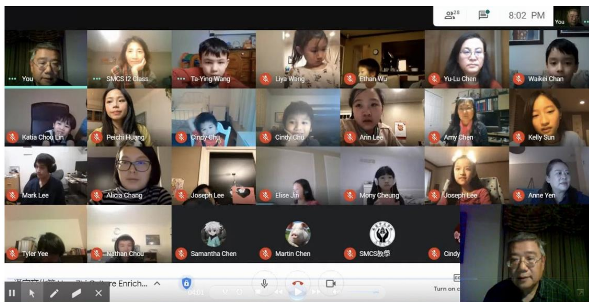
南密西根中文學校 2020 正體漢字文化節活動：中文打字暨漢語拼音比賽（線上）2