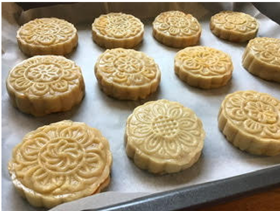
好吃的養生月餅完成了

本次活動所作的養生月餅，使用的份量是50克的冰糖粉、80克的奶油、45克的麥芽糖、4分之1茶匙的鹽、2顆蛋、250克的低筋麵粉、20克的奶粉、2分之1茶匙的小蘇打粉、400克的水、450克的地瓜、70克的蔓越莓乾。這是能作出15個月餅的份量，有興趣的朋友們也可以試做看看喔！