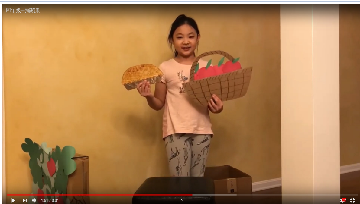
芝加哥克里夫蘭中文書院 2020 說故事比賽 (線上) 2