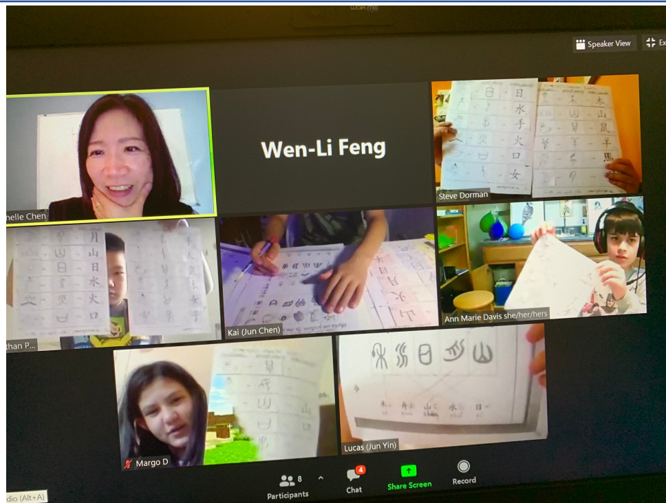
CSL-A：漢字的演化-學生配對象形文字到現代文字