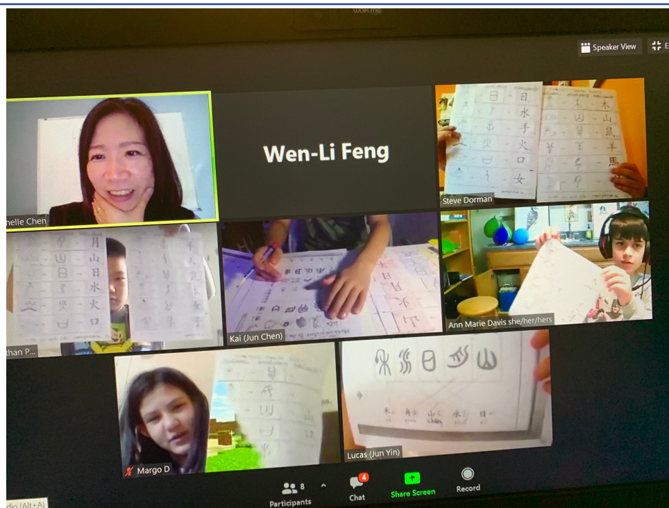
CSL-A：漢字的演化-學生配對象形文字到現代文字