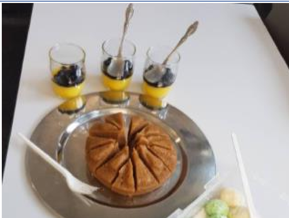
倫敦慈濟人文學校 2020 中秋文化趣味活動1