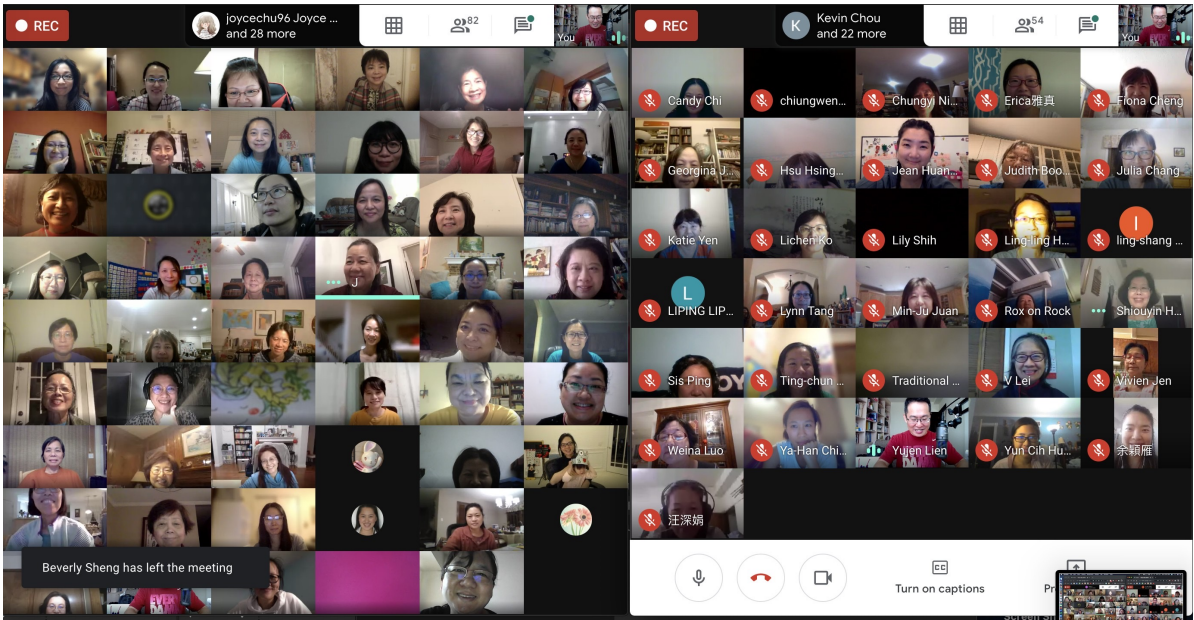
兩間教室部分同步上課學生