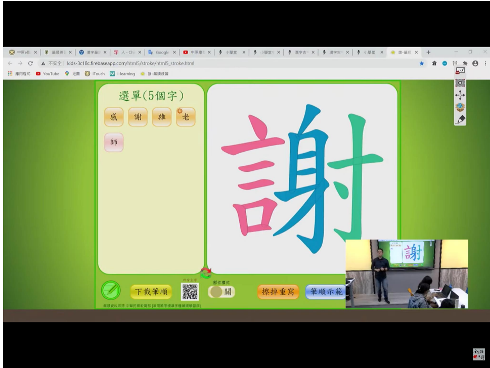
學生最佳的學習網站