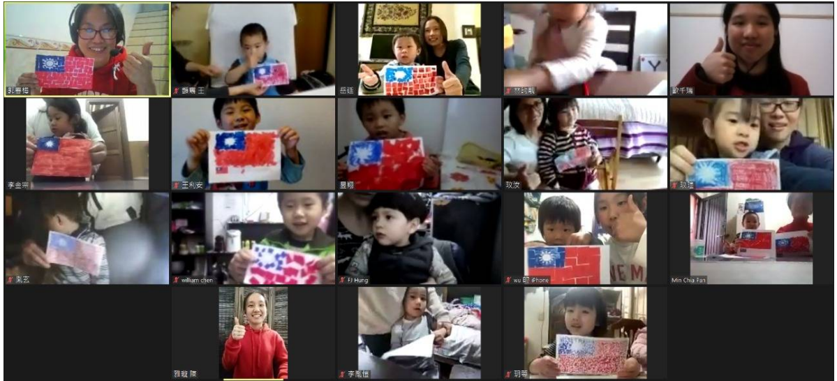
阿根廷華興學校 2020 正體漢字文化節：國慶注音勞作活動2