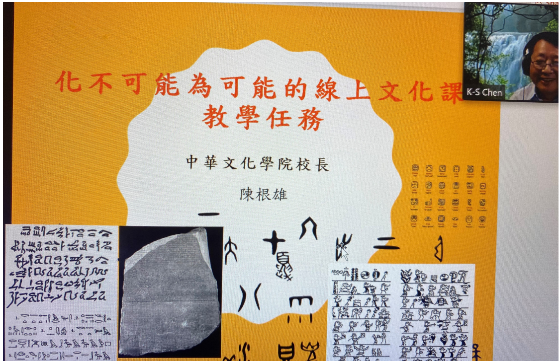
休士頓地區華文教師線上分享「文化教學」情形