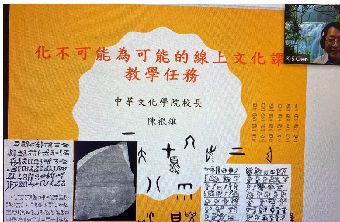
休士頓地區華文教師線上分享「文化教學」情形