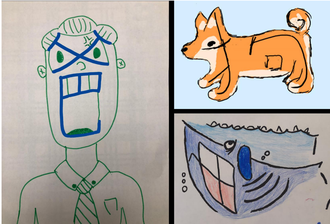
「繪畫學中文」優勝作品