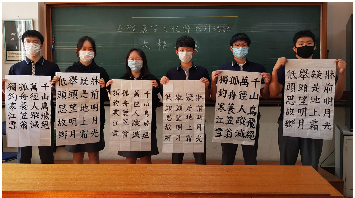
韓國仁川華僑中山中小學 2020 正體漢字文化節系列活動：書法比賽1

韓國仁川華僑中山中小學在此深深地感謝中華民國僑務委員會多年來對海外僑教文化的重視與協助。