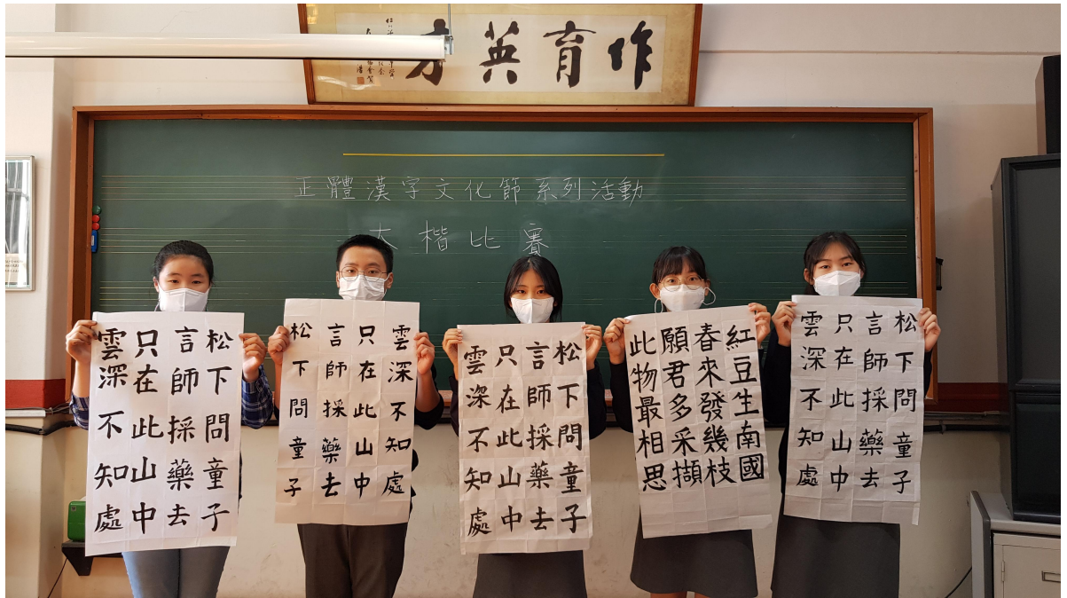
韓國仁川華僑中山中小學 2020 正體漢字文化節系列活動：書法比賽2