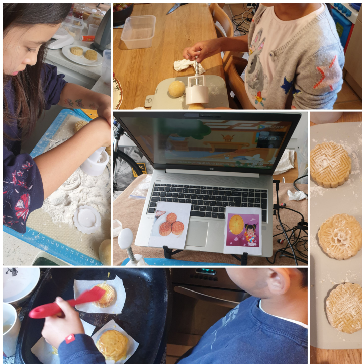
倫敦泰晤士中文班 2020 中秋節活動2