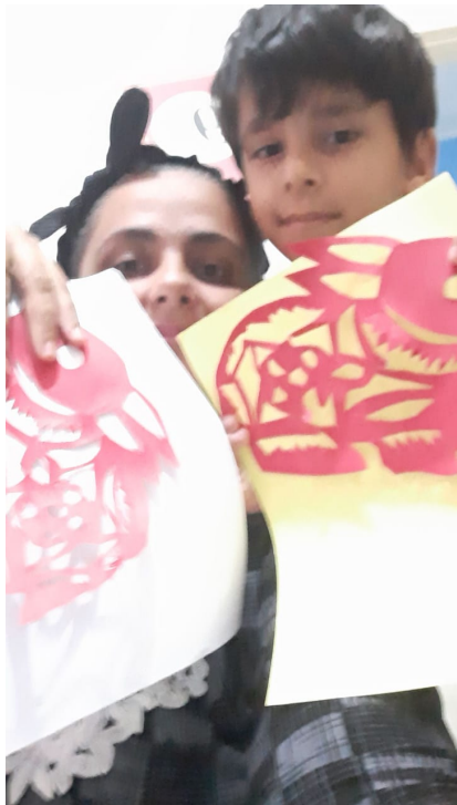
民眾分享完成之作品-玉兔剪紙