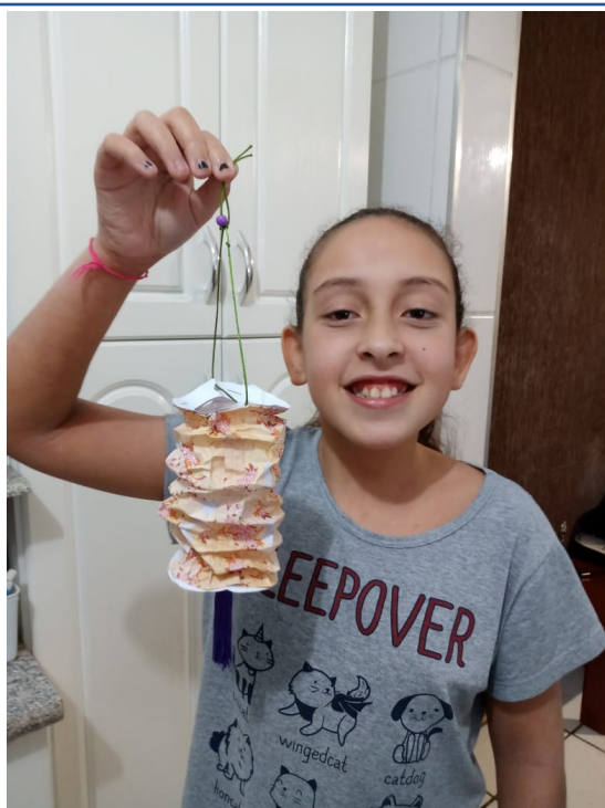
民眾分享完成之作品-風琴燈籠