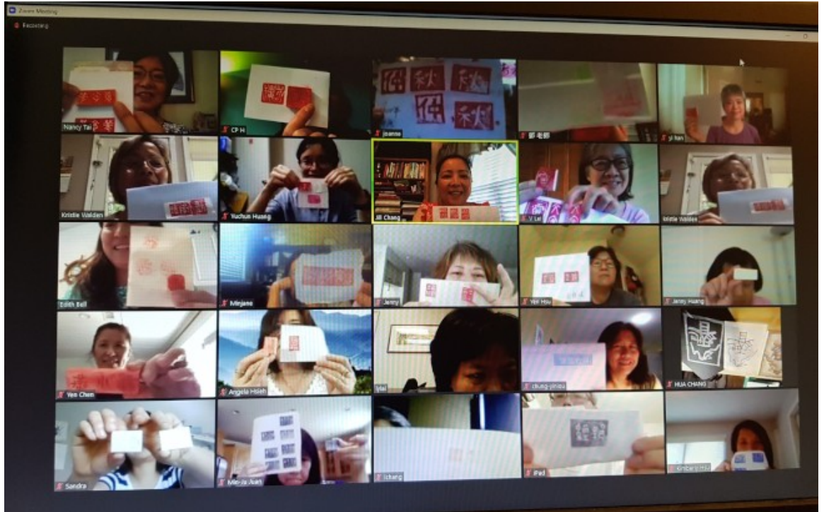
學員們展示自己雕刻的印章