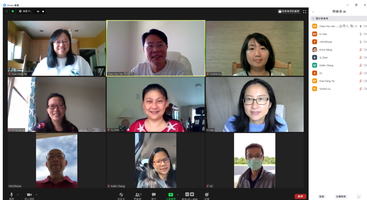
克里夫蘭中文書院 2020 華語文教學網頁製作研討會（線上）3