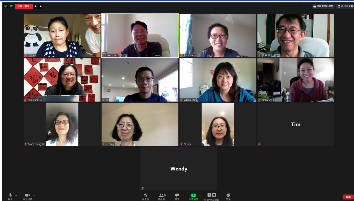
克里夫蘭中文學院 2020 師資培訓活動（線上）4