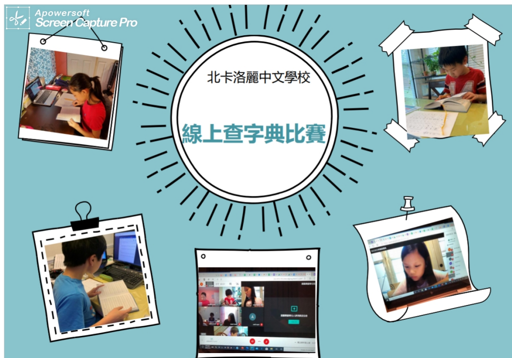
北卡洛麗中文學校網路查字典比賽開始囉！

比賽結果將於10月5日公布，為了鼓勵學生學習使用字典，除了得獎者以外，所有參賽者都將會被授予獎狀，以資鼓勵。