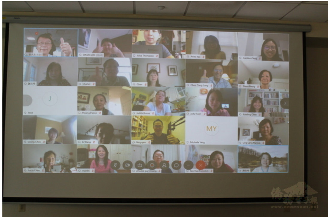
大華府地區2020年華文教師線上研習會學員合影。