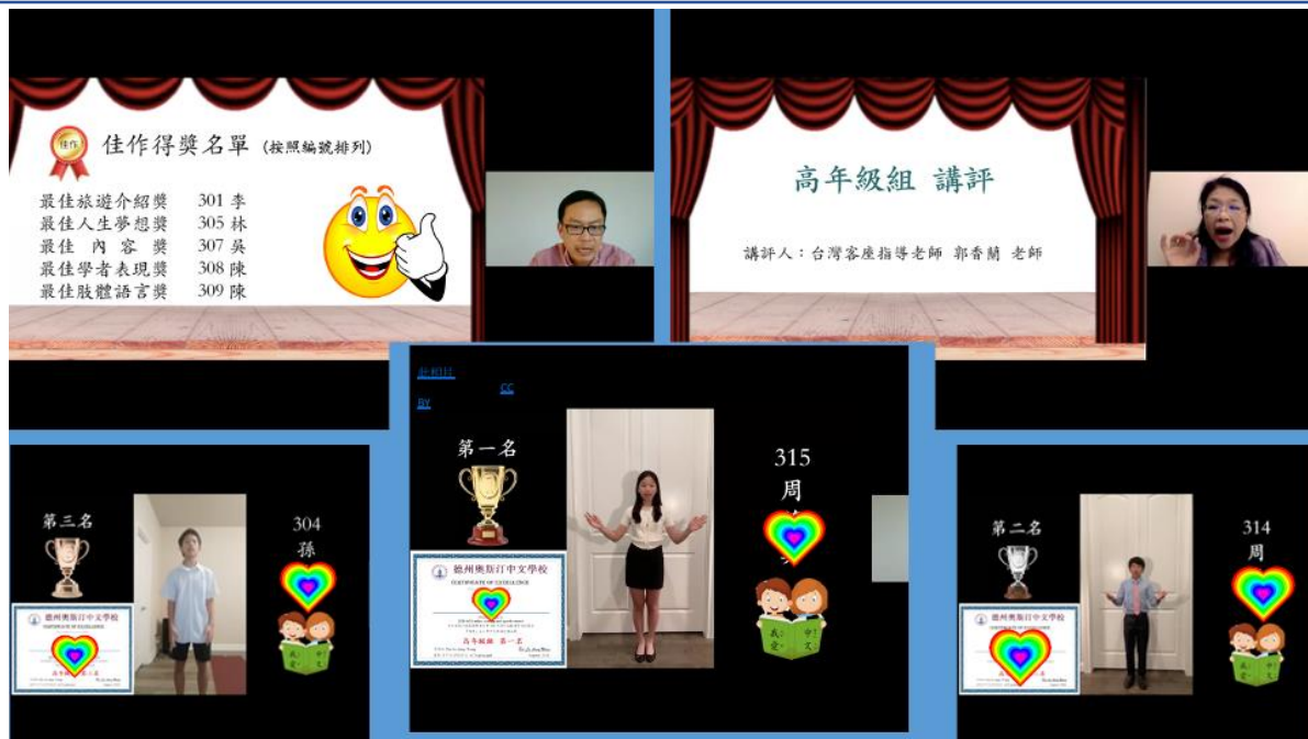
「朗朗」上口秀中文朗讀演講比賽頒獎典禮高年級組得獎名單