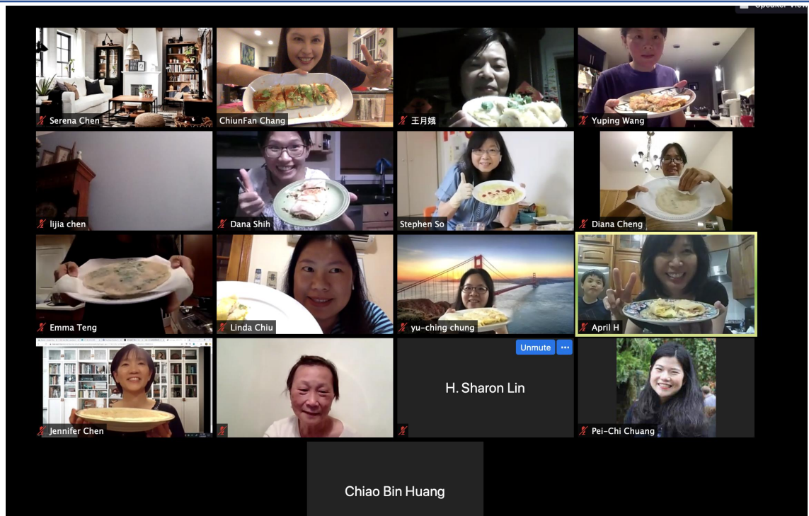
線上烹飪課，教師們製作美味的臺式古早味蛋餅