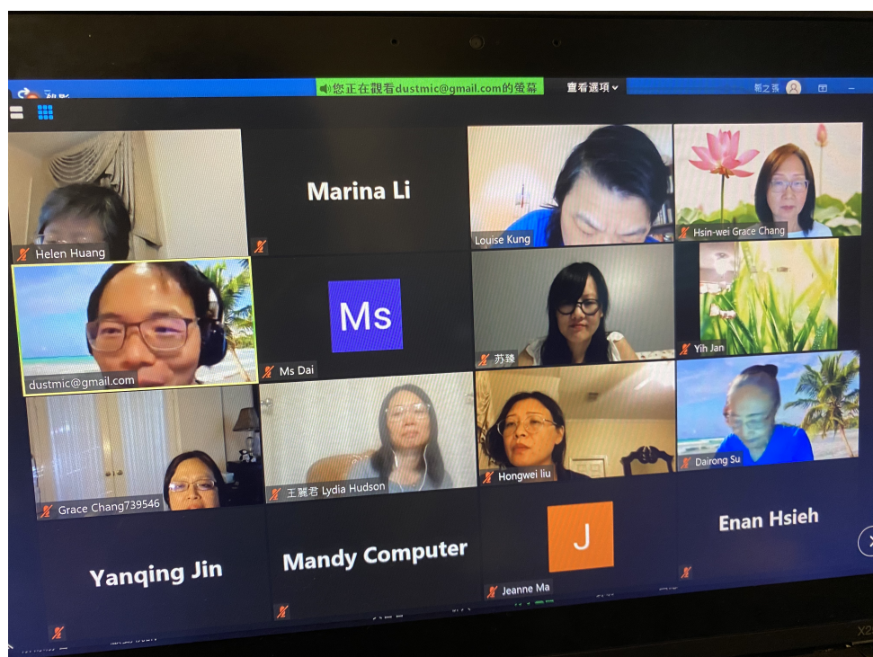
休士頓華文教師線上研習會的上課情形