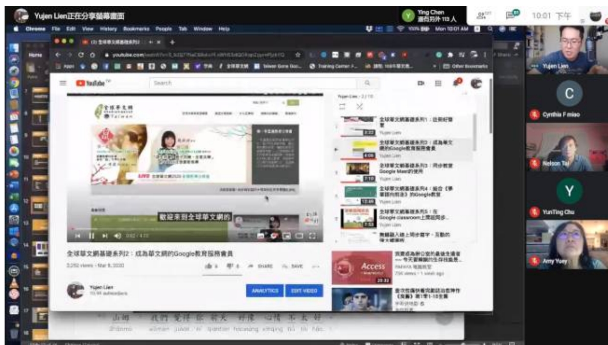
研習會的教學過程