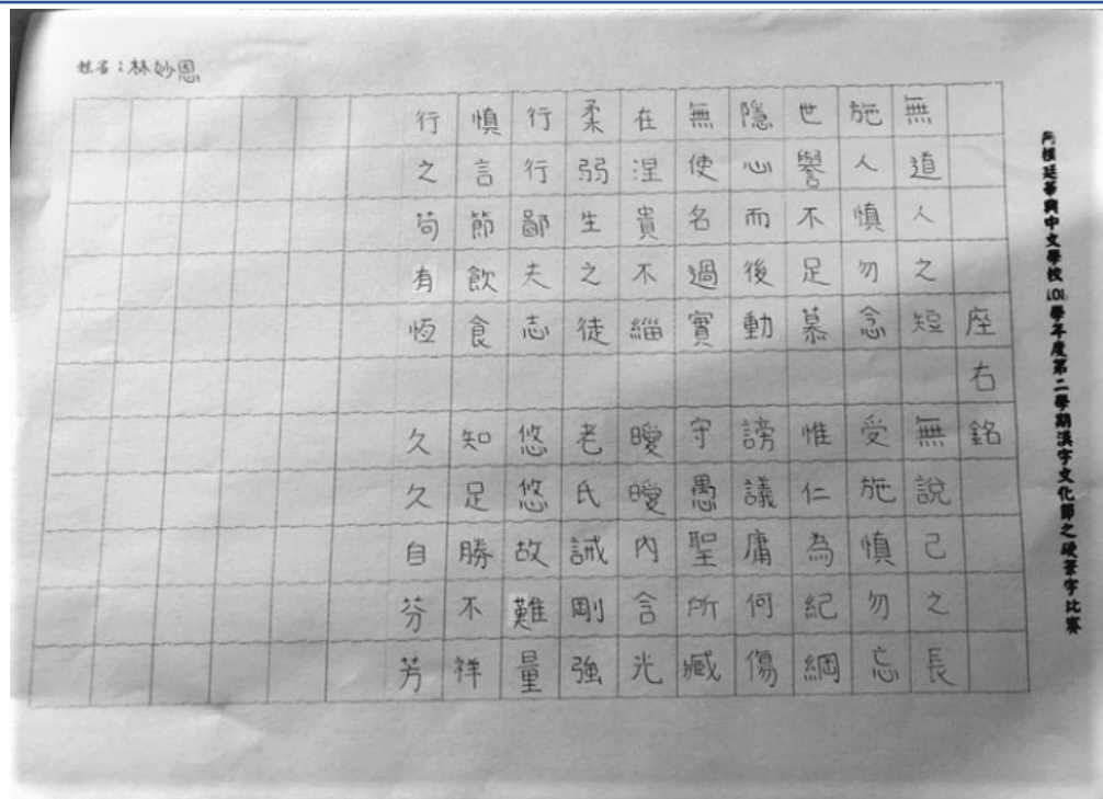
華興中文學校 2020 硬筆字活動2