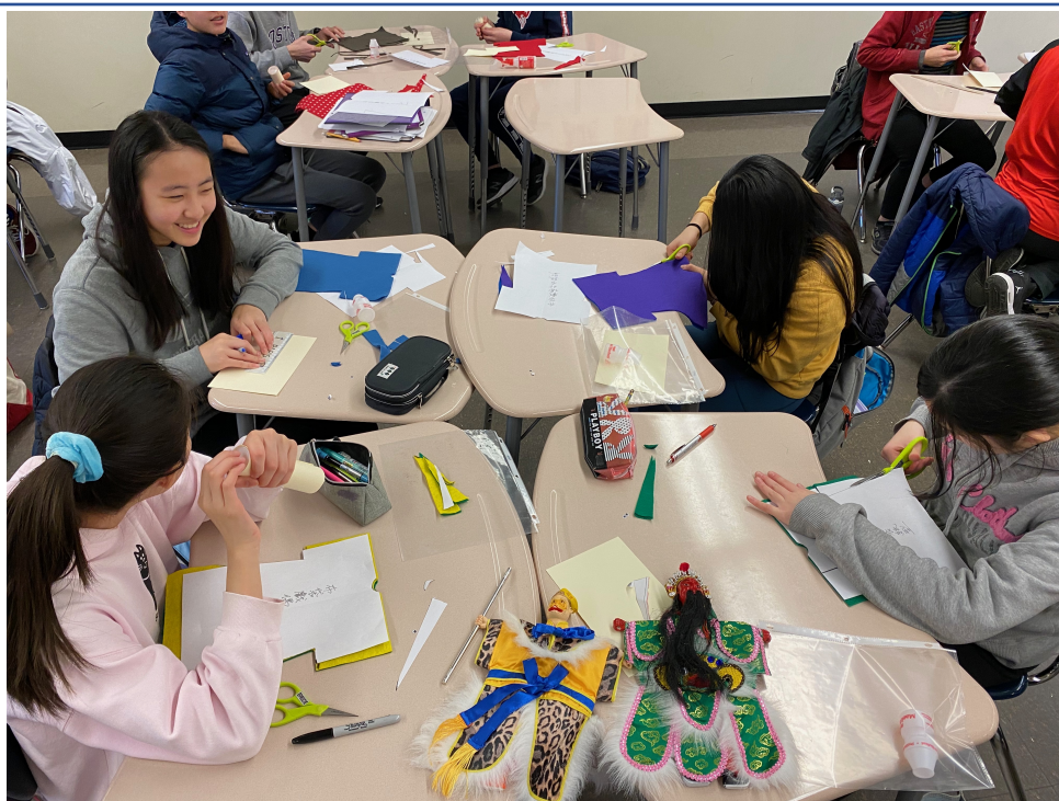
學生製作掌中戲偶。