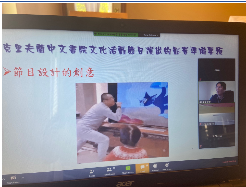
克里夫蘭中文書院 2020數位教學示範點教師培訓（線上）1