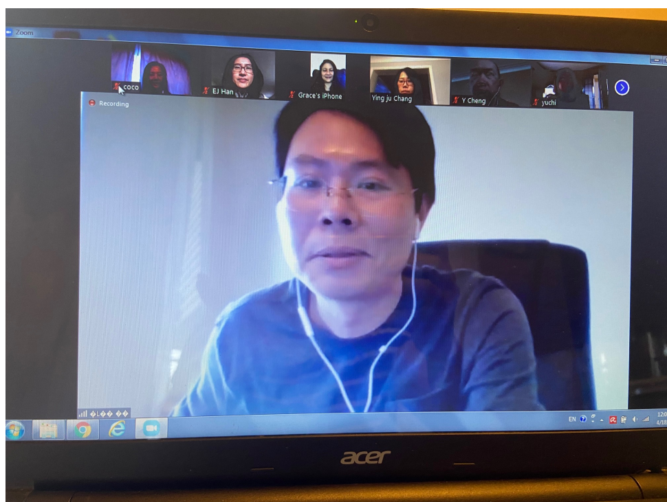
克里夫蘭中文書院 2020數位教學示範點教師培訓（線上）4