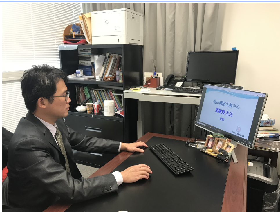
金山灣區僑教中心閻主任特別上線致詞勉勵與會者