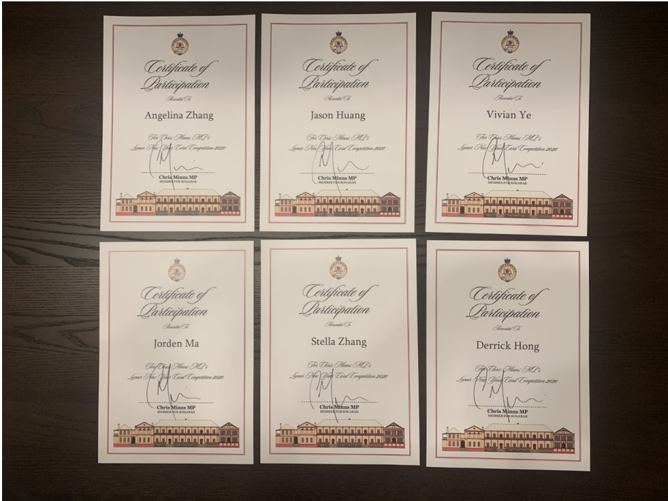
每個參賽同學都獲得參賽證書